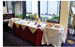
Dalle ore 13,00 alle ore 14,00: pausa pranzo