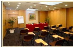
Aula lezioni presso Hotel Poliziano Fiera

diabete mellito, asma, difficoltà respiratoria, dolore toracico, congestione, colpi di calore, annegamento.